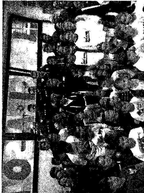
La delegazione granata con i bambini del centro "Il Girasole"