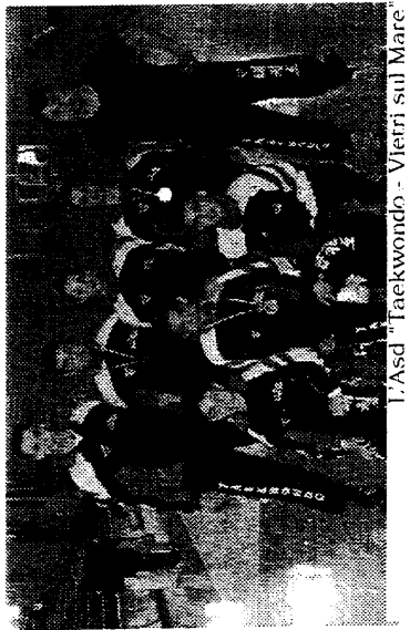
L'Asd "Taekwondo - Vietri sul Mare"