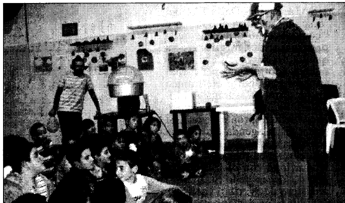
La cooperativa "Fili d'erba" nelle iniziative del fine settimana

Venerdì, presso il centro polifunzionale "Il Girasole" di Sant'Eustachio, è stato proiettato il film "Iqbal" sul delicato