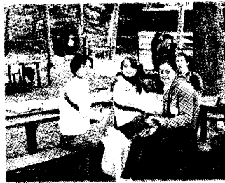
Colonia montana per i ragazzi